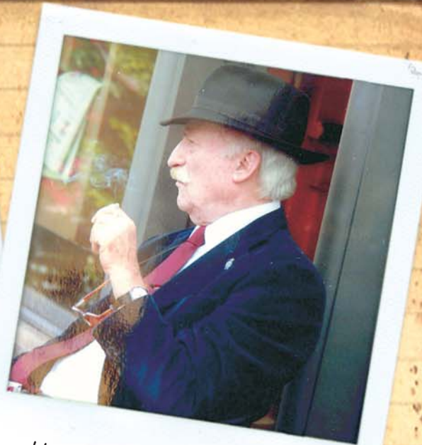
Un cigarro y una espera...