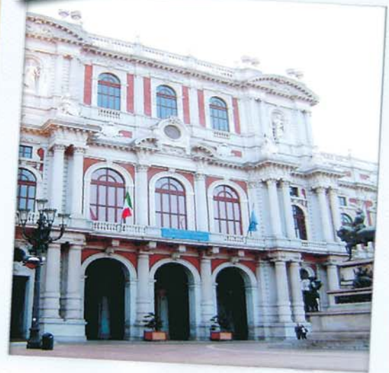
Museo nacional de Bellas Artes