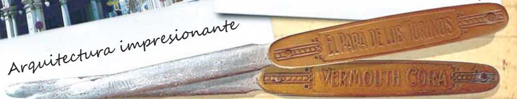
Abre carta promocional de la época Vermut Cora