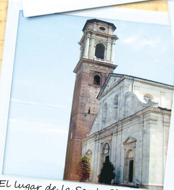
El lugar de la Santa Sindone, impresiona ver La Sábana con que envolvieron a Cristo