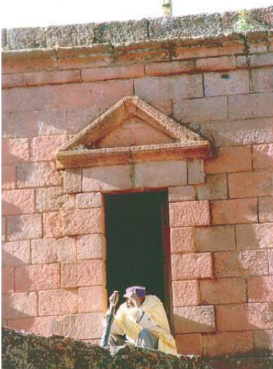
CUSTODIO Domina el panorama y vigila, aburridamente, las iglesias.

En "Lalibela" se hallan 10 iglesias que fueron excavadas y talladas en la piedra; miden desde arriba hacia abajo de 12 a 15 m aproximadamente. Hay que bajar por unas escaleras talladas para observarlas desde abajo.