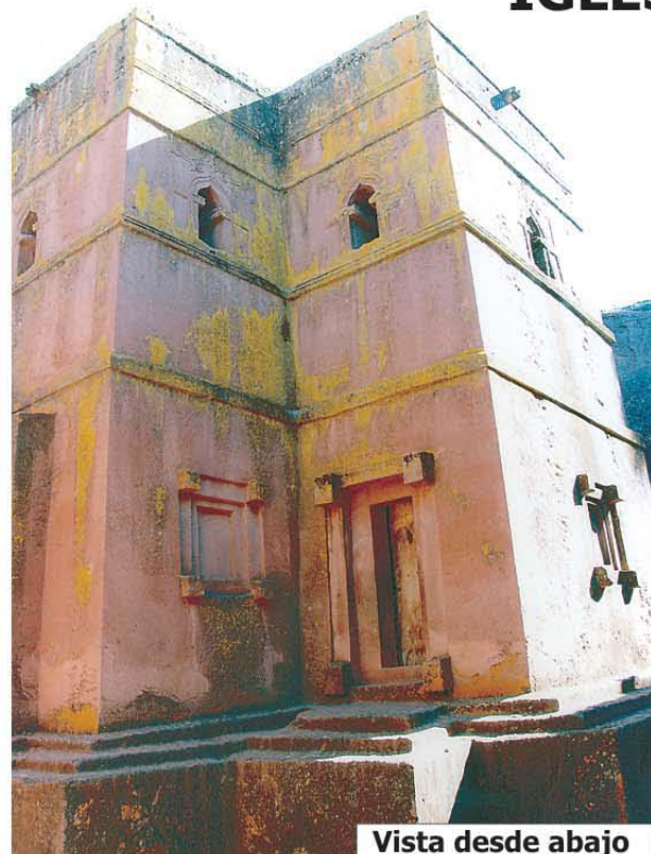
Vista desde abajo