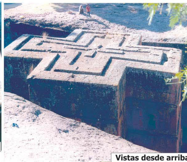
Vistas desde arriba

CRISTIANOS COPTOS Se celebran misas muy similares a la iglesia católica y son muy devotos de San Jorge.