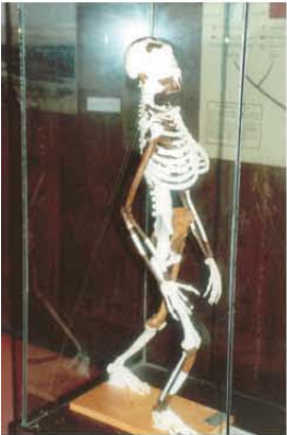
El esqueleto humano más antiguo del mundo encontrado en Etiopía.

País único, diferente. Su idioma oficial es el AMARICO, ningún otro país lo habla. LALIBELA es tal vez el mayor atractivo de Etiopía. Lleva el nombre de un rey muy famoso de la época.