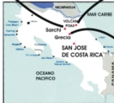
Costa Rica, incerta entre los dos océanos, Pacífico y Atlántico, en la parte más angosta de Centro-América junto a Panamá.

Volcán Poas actualmente en actividad. Este volcán está a una altura de 2.708 mts. Su cráter tiene aprox. 1 kilómetro y medio de diámetro. Constantemente se huele a azufre.