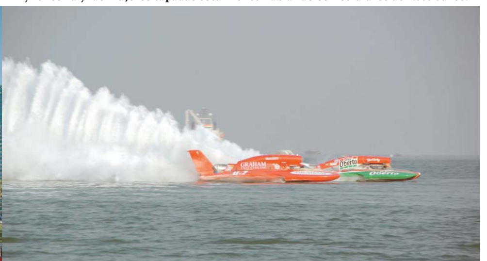
En estos Emiratos, para llamar la atención de los turistas, se juegan las finales de tenis, NBA, golf, motos, el partido de Argentina y Brasil, incluso la final del mundo con los 10 mejores del Off Shore.

Todo lugar a conocer "vale la pena", pues de él se aprende a valorar de dónde sos y/o corregir lo que está mal en el lugar donde vivís.