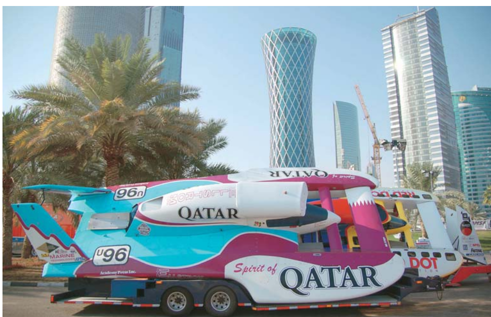
Monstruos de off shore, lujosos y carísimos.