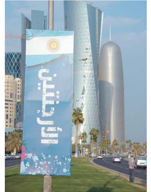
Estos banner que anunciaban el partido Argentina - Brasil y otros... había miles. Aquí en la Argentina cuestan muchísimo.