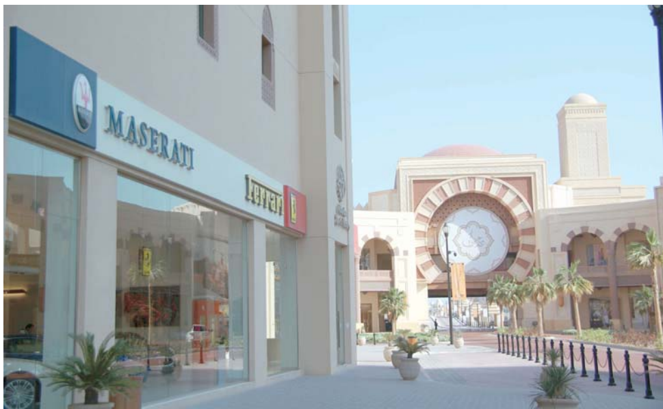
ENTRADA A LAS "DOS" ISLAS ARTIFICIALES. Cuando Dubai hizo una (la de las palmeras), los de Qatar dijeron "nosotros hacemos dos". A puro lujo, con entradas para yates de primerísimo nivel.