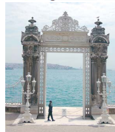
Espiando el Bósforo

Kayseri (antes Caesarea) desde el siglo IV se introduce el cristianismo por eso hay tantas iglesias en las cuevas.