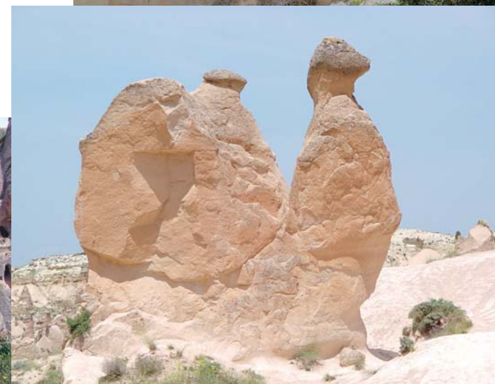
Figura semejante a un camello.