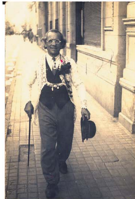
WORLD FILM 23 DE MAYO 2964/69 Que para busas? Compactación Ducan... Cr... ..