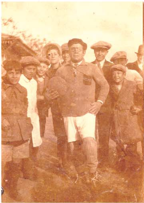
El 28 de Julio-1928 En Rafaela

AQUEL QUE SE ATREVE A CRUZAR ESA DELGADA, CASI INVISIBLE LINEA... QUE EL COMUN DE LOS OTROS "NO SE ATREVE ????" LOS QUE SI SE ANIMAN LOS HACE DISTINTOS"" , DIFERENTES, GRACIOSOS, GENIALES, LOCOS LINDOS, OCURRENTES. Y LOGRAN PERMANECER EN EL TIEMPO, Y EL RECUERDO... INCLUSO SE CONVIERTEN EN LEYENDAS. PUES SERA PATRIMONIO SOLO DE ELLOS, QUE EL BOCA A BOCA LES AGREGUE, NUEVOS INGREDIENTES A SU FIGURA.